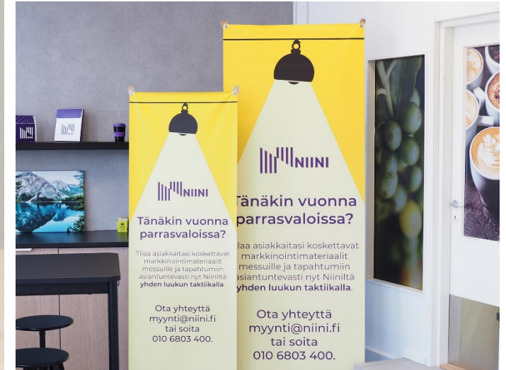
Etätyötausta (1200 mm leveä rollup), bamburollup (800 x 2200/600 x 1800 mm) sekä perusrollupit