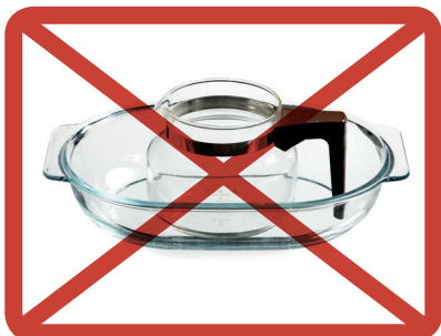
Lasiastiat » sekajätteeseen

Ethän laita: lasiastioita, lasiesineitä, lamppuja, posliinia tai keramiikkaa.