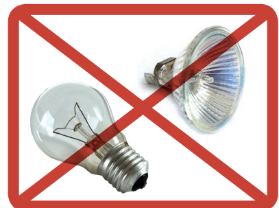
Halogenei- ja hehkulamput » sekajätteeseen