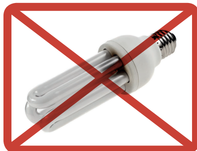
LED- ja energiansäästölamput, loisteputket » sähkölaitteiden tai vaarallisen jätteen keräykseen