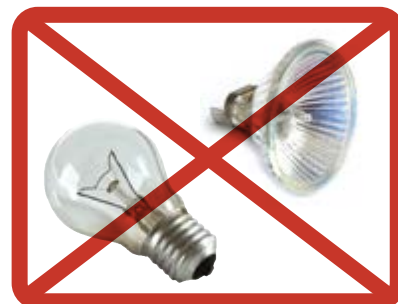
Halogen- och glödlampor » blandavfallet