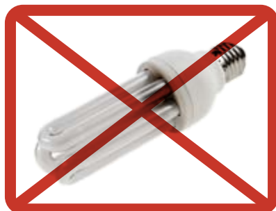
LED- och energisparlampor, lysrör » insamlingen av elapparater eller farligt avfall