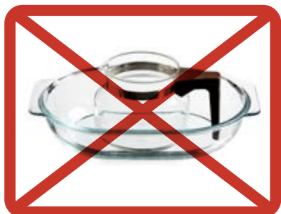
Glaskärl » blandavfallet

glaskärl, glasföremål, lampor, porslin eller keramik.