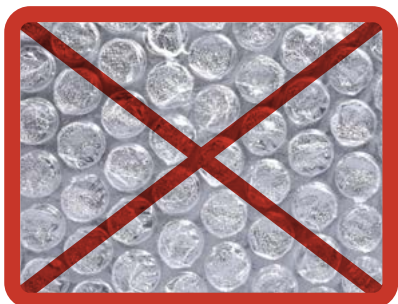
Kuplamuovi » muovipakkausten keräykseen

kuplamuovia, styroksia, lahjapaperia, kirjankansia tai muovipusseja.