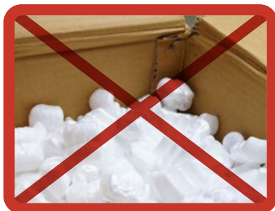
Pakkausstyroksi » muovipakkausten keräykseen