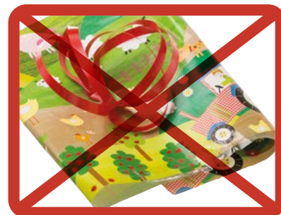
Lahjapaperi » sekajätteeseen